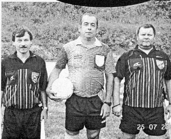
Rozhodcovská trojica sa postarala o hladký priebeh turnaja