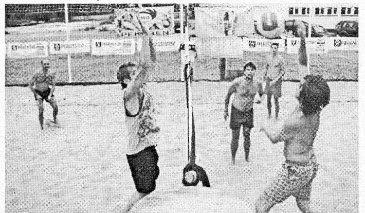
Hráči v plnom nasadení