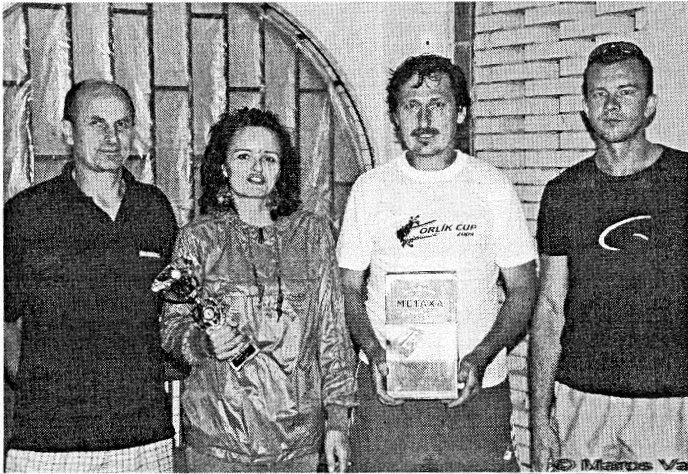
Víťaza v šiestom ročníku určila minca. Šťastie sa usmialo na klub POLAR V. Krtíš.

Už po šiestykrát sa na ihrisku plážového volejbalu pri krytej plavárni vo V. Krtíši uskutočnil v sobotu 18.7. volejbalový turnaj zmiešaných družstiev neregistrovaných hráčov. Usporiadal ho domáci Volejbalový klub Polar s podporou Mesta V. Krtíš a Krytej plavárne.