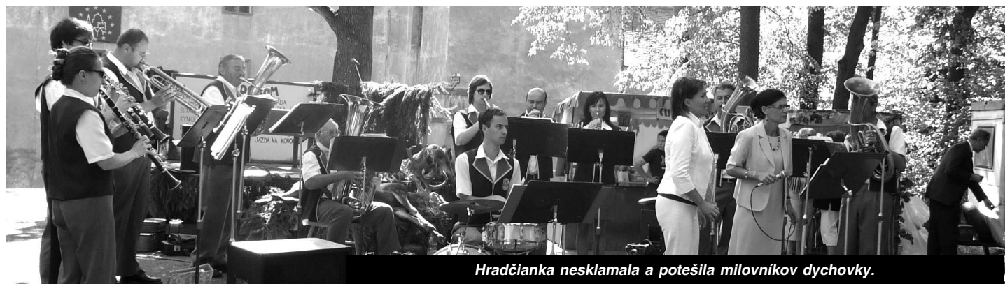
Hradčianka nesklamala a potešila milovníkov dychovky.