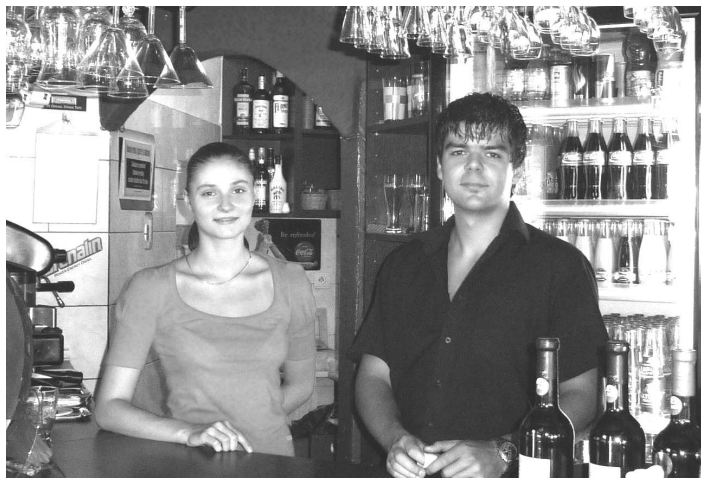
Čašníci z Koaly vás radi obslúžia vnútri ale aj vonku na terase