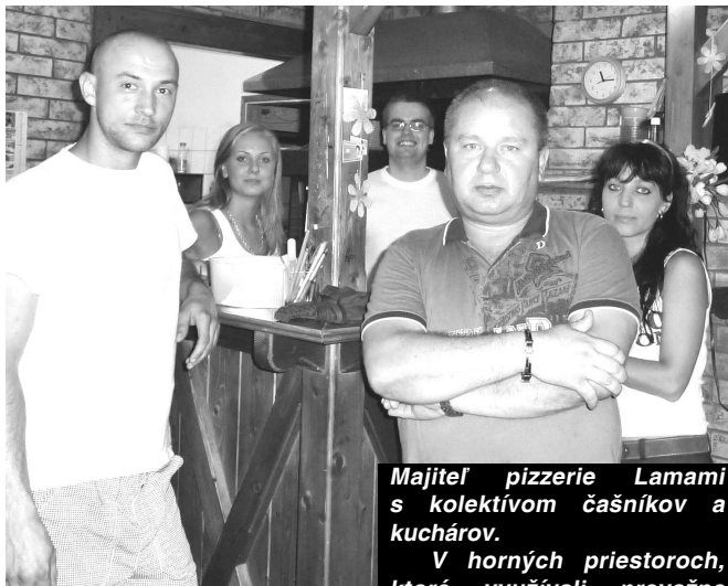
Majiteľ pizzerie Lamami s kolektívom čašníkov a kuchárov.

* Predavačka (23 r.), Velký Krtíš "Vyfajčím asi balík cigariet denne, čo ma do mesiaca stojí približne 60 eur. Chodievam aj do reštaurácií a iných podnikov a podľa mňa na miestach, kde sa vydáva strava, by sa fakt nemalo fajčiť, ale pokiaľ je to podnik, kde sa jedlo nekonzumuje, tak prečo nie. Bola som v Lučenci a tam sa nemohlo fajčiť ani na terase, to je už riadna hlúposť."