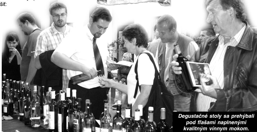
Degustačné stoly sa prehýbali pod fľašami naplnenými kvalitným vínnym mokom.