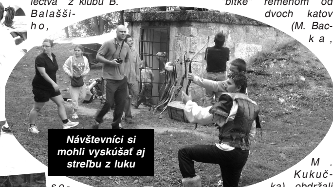
Návštevníci si mohli vyskúšať aj streľbu z luku

miesto získalo PZ D. Strehová, druhé PS M. Kameň a tretie Nová Ves. Aj touto cestou ešte raz víťazom blahoželáme. Zaujímavou súťažou bolo aj pílenie dreva, v rámci ktorej sme zistili, že najmocnejší chlapi bývajú v Plachtinciach. Podujatie doplnili programy v hradnej priekope: ukážky lukostrelectva z klubu B. Balašeho,