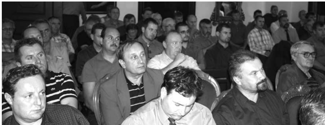
Záujem o problematiku nového zákona a predlžovaní nájomných zmlúv v poľovních revíroch okresu prilákal na prednášky množstvo poľovníkov .

"Národná poľovnícka samospráva komorového typu - SLOVENSKÁ POĽOVNÍCKA KOMORA sa člení na obvodné komory, ktoré pôsobia spravidla v územnom obvode (Pokračovanie na str.7)