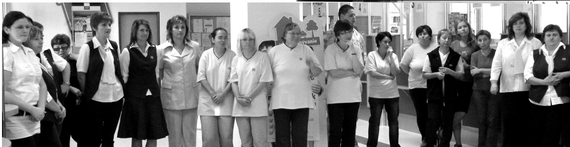
Pracovníci Pošty vo V. Krtíši po slávnostnom otvorení prevádzky s napätím očakávali na zákazníkov a ich reakcie.