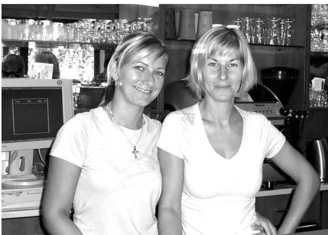
V reštaurácii Jakub vás privítajú aj tieto dve, vždy usmiate čašníčky

V reštaurácii Jakub na Nemocničnej ulici majú otvorené každý deň okrem nedele od 10.00 hod. do 21.00 hod. -AĽA-