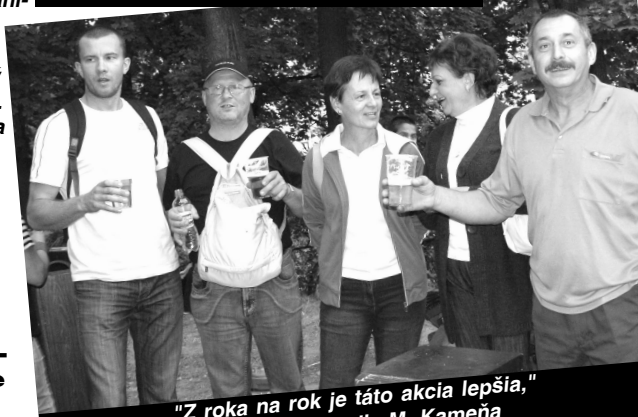
"Z roka na rok je táto akcia lepšia," tvrdia obyvatelia M. Kameňa

miesto získalo PZ D. Strehová, druhé PS M. Kameň a tretie Nová Ves. Aj touto cestou ešte raz víťazom blahoželáme. Zaujímavou súťažou bolo aj pílenie dreva, v rámci ktorej sme zistili, že najmocnejší chlapi bývajú v Plachtinciach. Podujatie doplnili programy v hradnej priekope: ukážky lukostrelectva z klubu B. Balašeho,