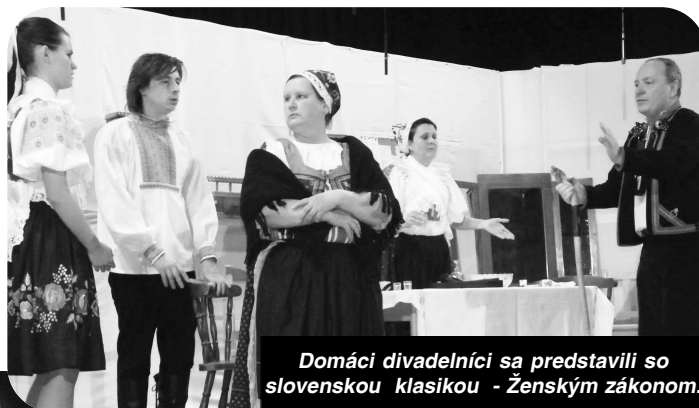
Domáci divadelníci sa predstavili so slovenskou klasikou - Ženským zákonom.

dina a zo ZUŠ Modrý Kameň s predstavením Šarhan. Tretia priečka patrila domácim dolnostrehovským žiakom z DS Pramienok, ktorí zahrli hru Ples kvetín.