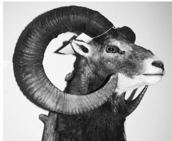
Muflón strelca z D.Strehovej J.Jasa získal zlato a 219,95 b.

Samotná prehliadka je určená všetkým, ktorí majú záujem o prírodu, po-