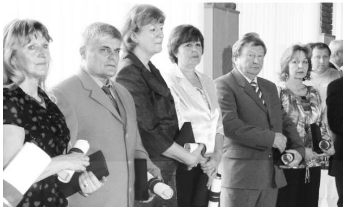
Niektorých učiteľov potešilo okrem osláv ich sviatku aj ocenenie za prácu

Banskobystrický samosprávny kraj venuje nemálo prostriedkov aj na rozvoj vzdelania a kultúry obyvateľov nášho kraja. Sám je zriaďovateľom 79 škôl a školských zariadení a do jeho pôsobnosti spadá aj 416 obecných a 6 regionálnych knižníc. Najlepších pedagógov i knihovníkov pravidelne každý rok oceňuje.